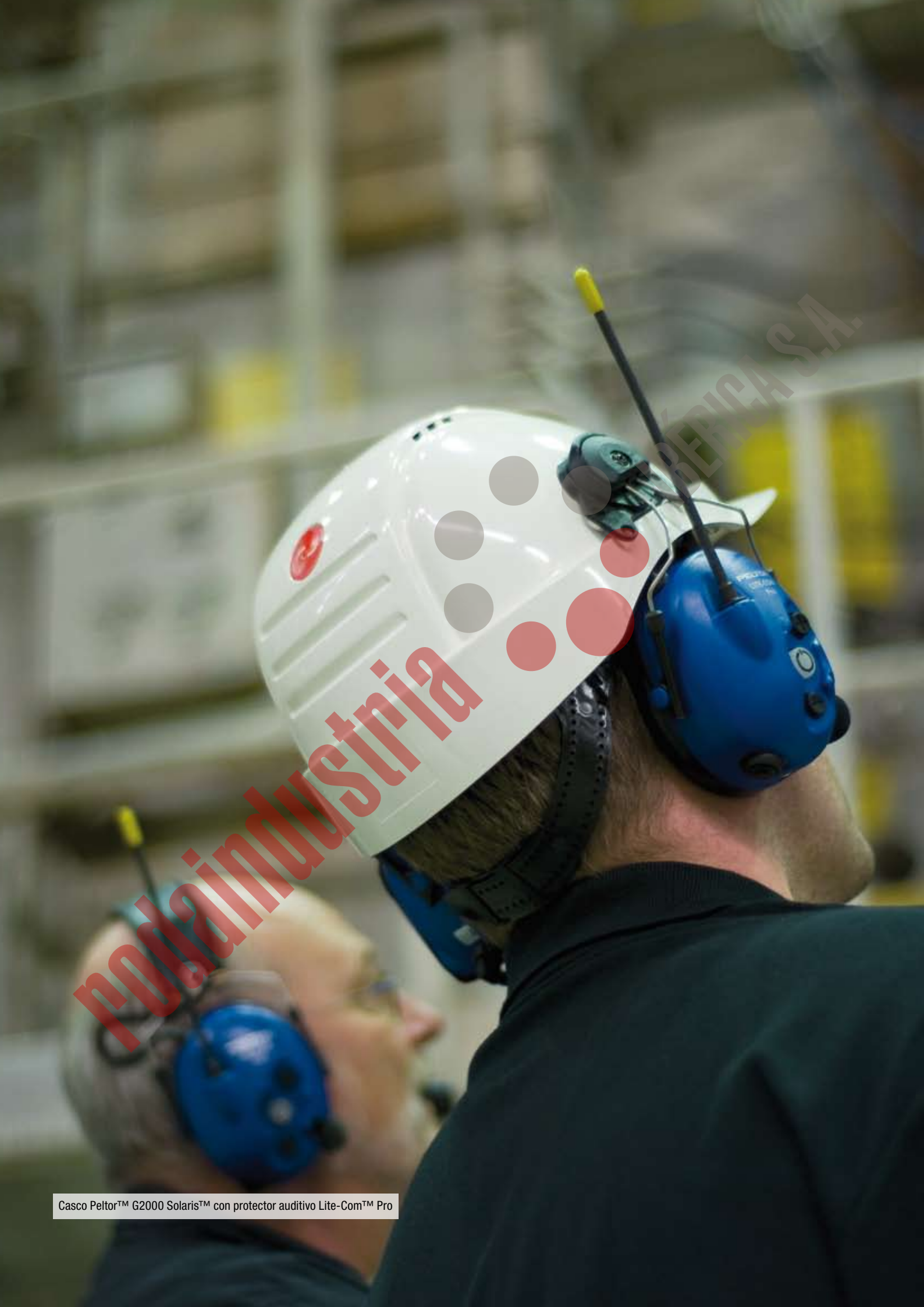
Casco Peltor™ G2000 Solaris™ con protector auditivo Lite-Com™ Pro