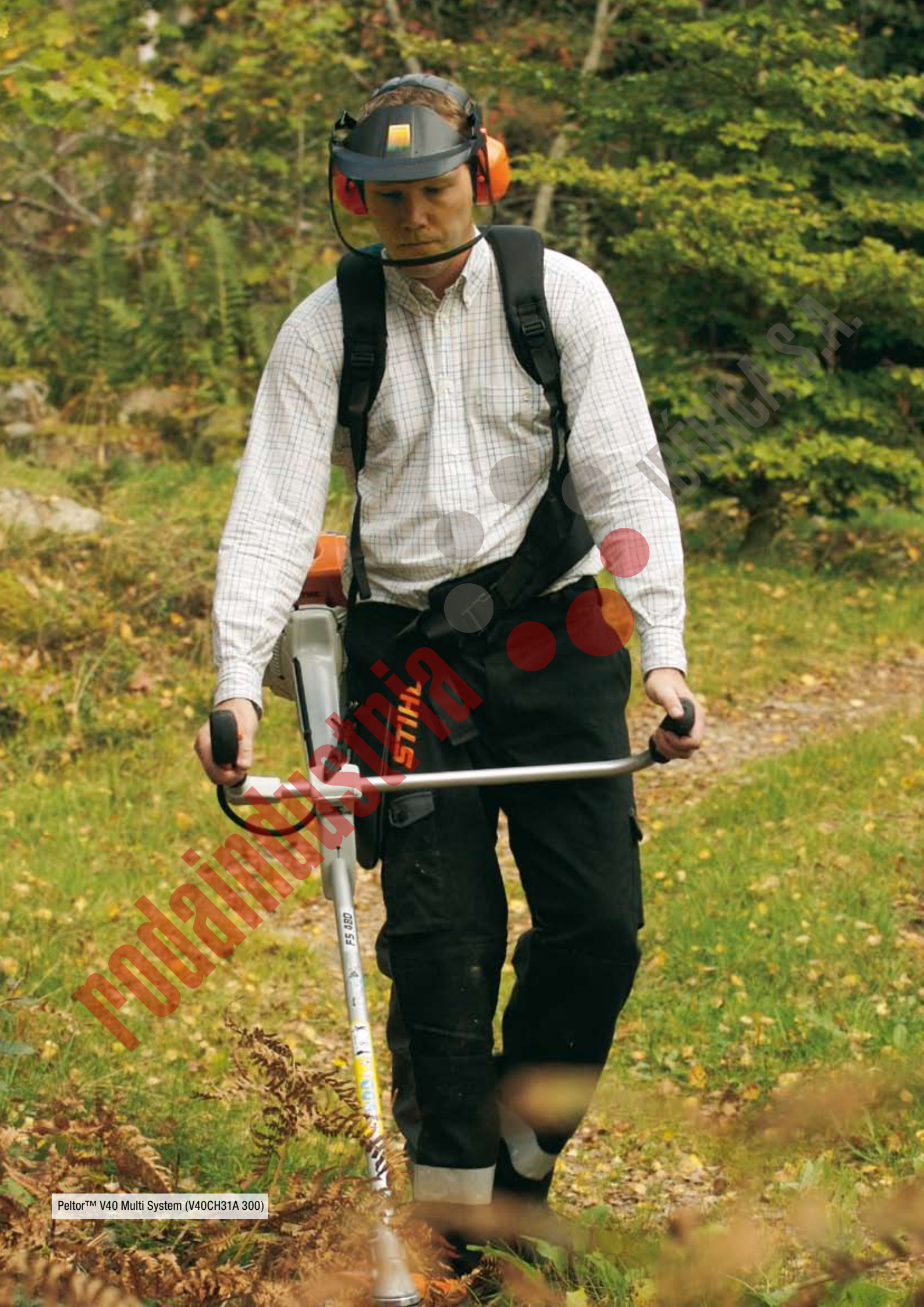
Peltor™ V40 Multi System (V40CH31A 300)