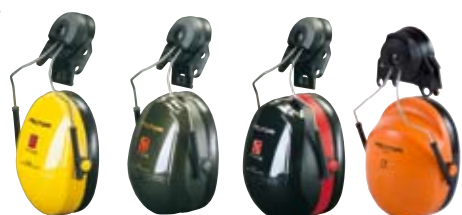
H510P3* H520P3* H540P3* H31P3*